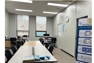
국민취업지원실 (도서관 3층)