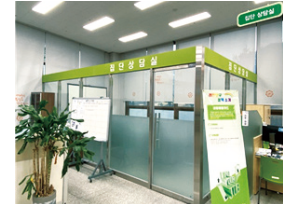
집단상담실 (도서관 1층)