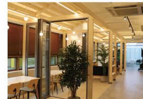
3UP STATION 다목적 공간