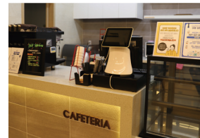
3UP STATION 카페테리아