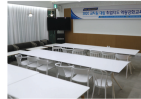
3UP STATION 세미나실