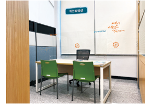
개인상담실 (도서관 1층)