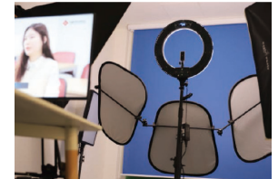
3UP STATION Media Platform