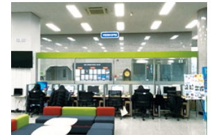
취창업정보검색실 (도서관 1층)