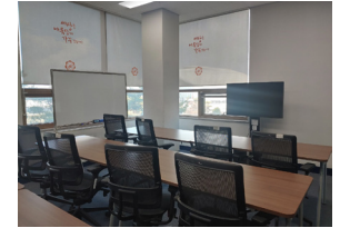
취창업전용강의실 (도서관 2층)