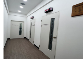
시모의면접실 (도서관 2층)