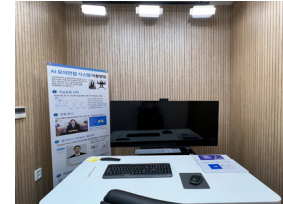
시모의면접실 (도서관 2층)